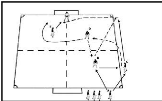
Æfing 3 - Uppspilsæfing, samhæfa sóknarfærslur

Völlur án marka, skipt í þrjá hluta, 24 x 36 metra. Tveir sóknarmenn gegn einum varnarmanni á hverjum hluta. Einn sóknarmaður frá hverjum hluta má hjálpa þannig að staðan verði 3:1. Markmiðið að ná fimm sendingum áður en færa má boltann á milli vallarþriðjunga. Varnarmenn vinna í þrjár mínútur. Tvær snertingar, en nota eina snertingu ef hægt er.